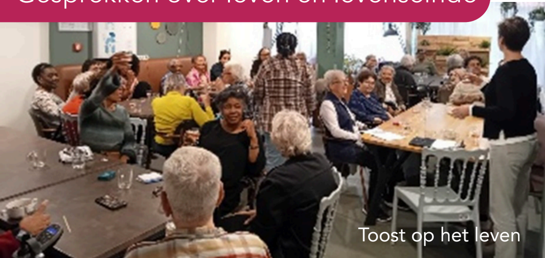
Toost op het leven

Amsterdam UMC ontving in 2026 een onderwijsinnovatieprijs voor Serious Gamechangers in het palliatieve zorgonderwijs. De NPZA is hierbij betrokken door het faciliteren van betekenisvolle gesprekken tussen geneeskundestudenten en inwoners, onder de titel Toost op het Leven!