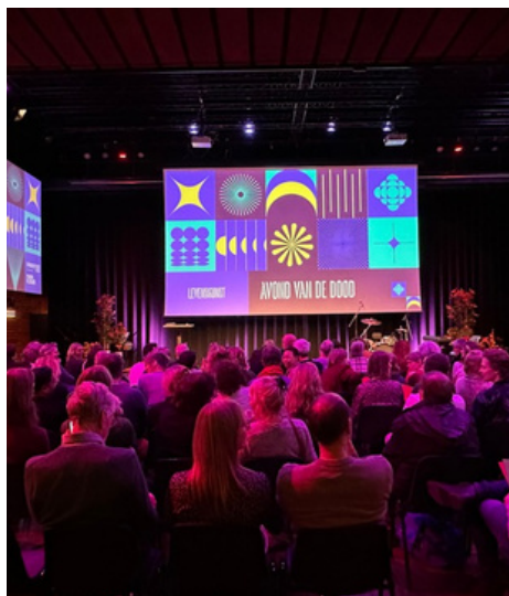
Avond van de dood: 350 bezoekers